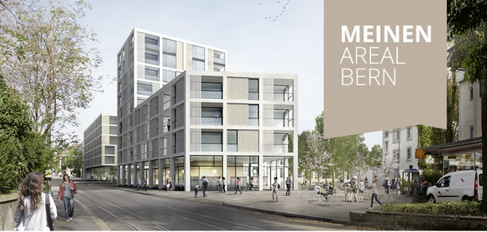
Visualisierung: Brunnmattstrasse Blick Richtung Norden